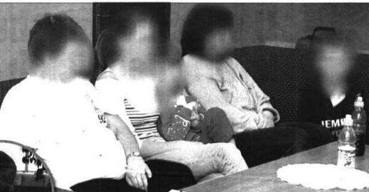
Žene koje su se uspjele otkloniti od nasilnika hrabro su progovorile o svojim tragičnim sudbinama

Nasilni su ih muževi psihički i fizički maltretirali godinama